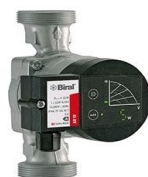
Biral Typ AX12-1