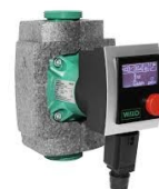
Wilco Stratos Pico25 25/1-4

Jede Hocheffizienzpumpe mit Einbau für nur 299,- Euro